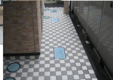
廊下床面はタイル張り