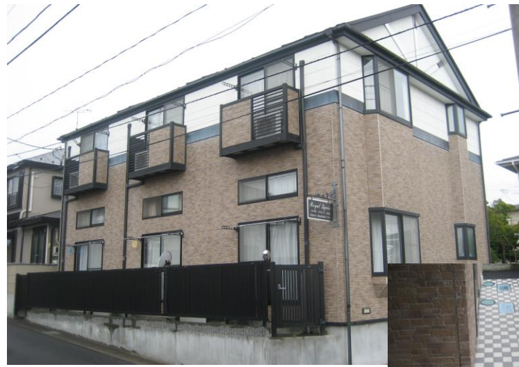
外壁はタイル調仕上げ