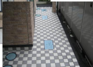
廊下床面はタイル張り