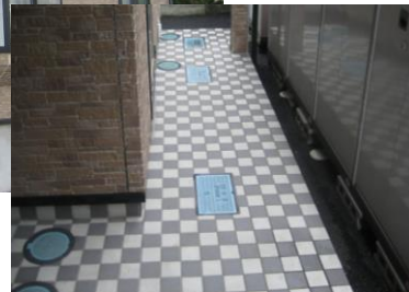
廊下床面はタイル張り