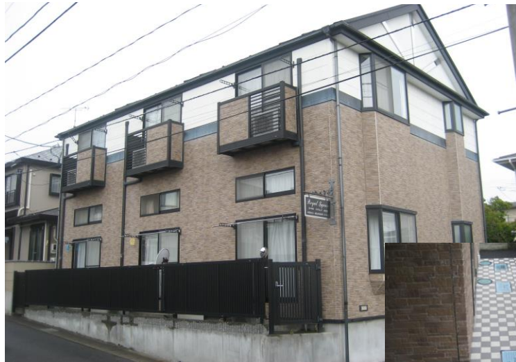
外壁はタイル調仕上げ