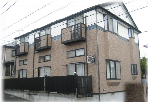
外壁はタイル調仕上げ