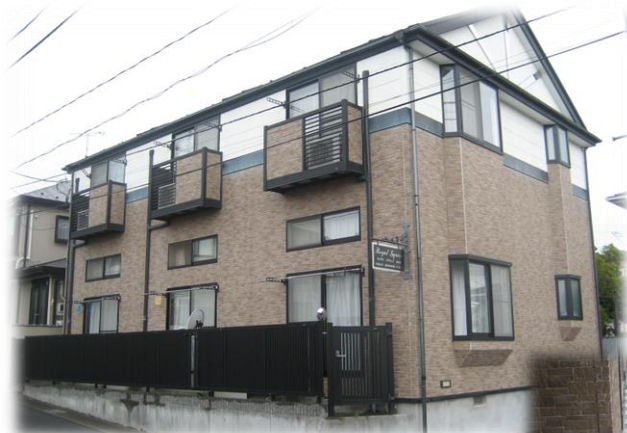
外壁はタイル調仕上げ