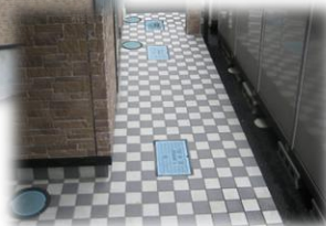
廊下床面はタイル張り